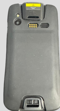
Capa de borracha tipo "bumper"