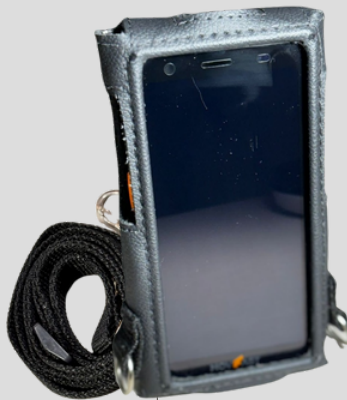
Capa de proteção em couro com alça de ombro