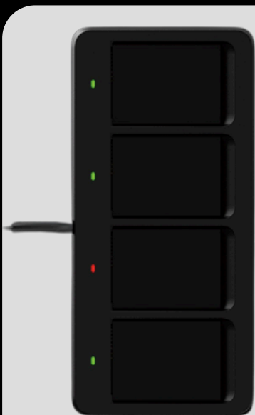
Carregador de 4 posições