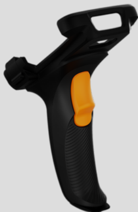
Gatilho para R2