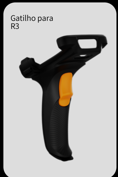
Gatilho para R3

Contate-nos: ☎ +55 11 97196-7355 ✉ contato@movfast.com.br 🌐 movfast.com.br