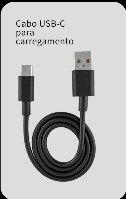
Cabo USB-C para carregamento