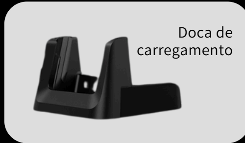
Doca de carregamento