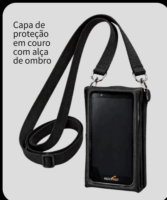
Capa de proteção em couro com alça de ombro