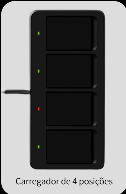
Carregador de 4 posições