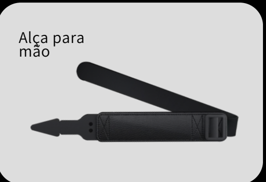
Alça para mão